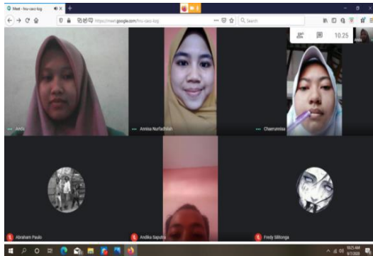
Gambar 1. Pembelajaran daring dengan metode pembelajaran tanya jawab

Pertemuan ke-2 menggunakan pembelajaran daring, metode pembelajaran presentasi dan tanya jawab. Aplikasinya yaitu Peserta didik melihat pembahasan soal dan mengumpulkan tugas yang sudah diberikan menggunakan media Whatsapp Group , Google Meet dan Google Classroom .