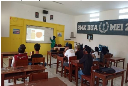
Gambar 3. Pembelajaran Luring dengan metode pembelajaran diskusi dan latihan

Pertemuan ke-4 menggunakan pembelajaran daring, metode pembelajaran presentasi dan tanya jawab. Aplikasinya memberikan materi dan mempersilahkan peserta didik untuk melakukan tanya-jawab terkait materi dibantu dengan media Whatsapp Group .